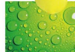
(3) JAB Anstoetz (5) Anthologie Quartett (6) Hay (7) BBB emmebonacina (8) Artemide