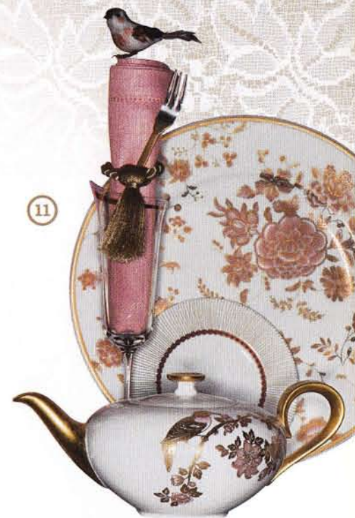
(7) Luisa Claire (8) Pii (9) Stuart Weitzman (10) Marie's Corner (11) Villeroy & Boch